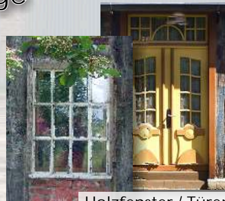
Holzfenster / Türen